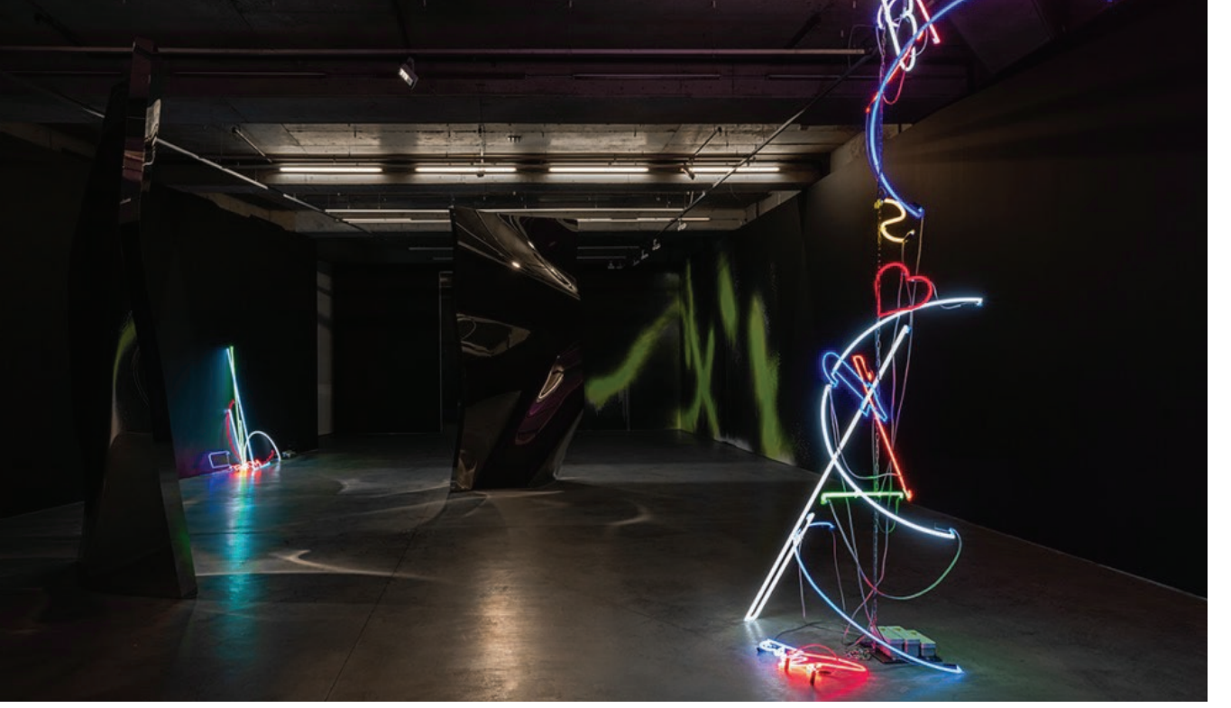
“Kozmik Boşluk” sergisinden yerleştirme görüntüsü, Fotoğraf: Nazlı Erdemirel