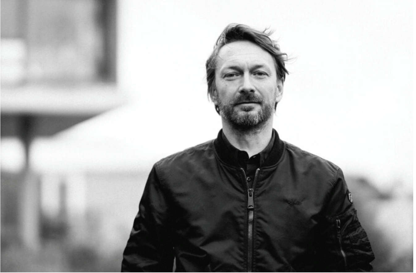
Anselm Reyle

İsyan ile gelenek arasındaki ilişkiye benzer şekilde çürüme ile canlılık, gerçek ile hayal, karanlık ile ışık gibi birçok karşıtlık klişelerin ötesine geçerek gerek enstalasyon gerekse akrilik işlerinizde kendisine önemli bir yer buluyor. Bu tür karşıtlıkları sizin sanatınızda ve “Kozmik Boşluk”ta bu kadar özel kılan nedir? Eserlerinizdeki zıtlık temsilleri üzerine ne söylersiniz?