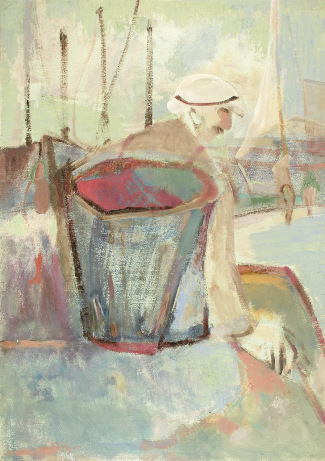
İsimsiz (Sepetli adam)