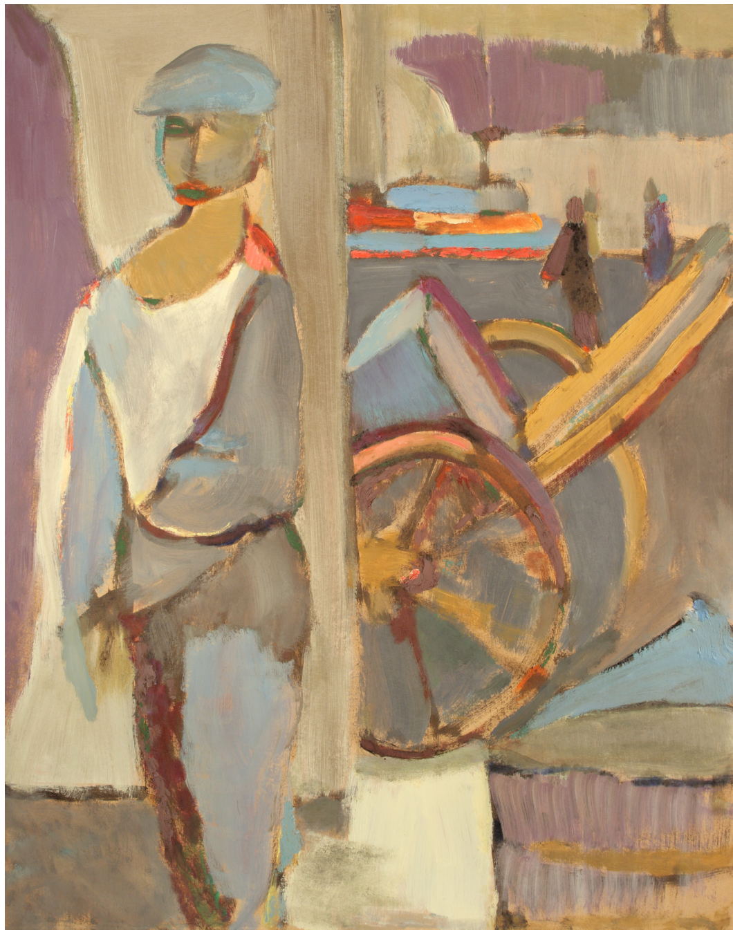
İsimsiz (El arabası) Untitled (Wheelbarrow) 1972 Karton üzeri yağlıboya Oil on cardboard 100 x 80 cm