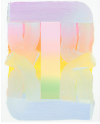
Çiğdem Aky No sweets , 2023 Tüval üzerine akrilik ve yağlıboya 125 x 100 cm

Dirimart, Çiğdem Aky'nin galerideki ilk kişisel sergisi olan Ânın Peşinde 'yi sunmaktan mutluluk duyar. Sergi, sanatçının son dönemde İstanbul ve Münih'te ürettiği, ışığa odaklanan resimlerini bir araya getiriyor. Sanatçı sergideki yeni işlerinde gündoğumu ve günbatımındaki renk geçişlerini izleyerek tek bir kompozisyonu takip eden renk odaklı bir üslup sunuyor.