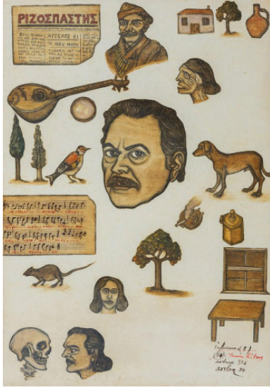
Arture 326, Influences (B)-54 (Y. Ritsos) 1984 Kâğıt üzerine karışık teknik 30 x 21 cm

Sui generis , “kendine has”, “nevi şahsına münhasır”, dolayısıyla “biricik” anlamına gelen Latince bir ifade. Yaratıcı sanatlar, türün geleneksel sınırlarını aşan sanat eserleri için.